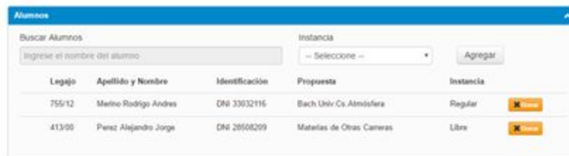
Imagen 3: Carga de estudiantes al acta

Una vez finalizada la carga de todos los estudiantes, pulse el botón ubicado en el margen superior derecho Guardar .