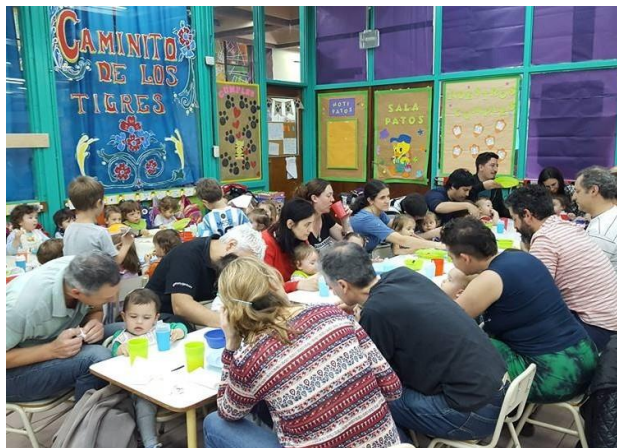
Actualmente asisten al Jardín Materno-Infantil: “Mi Pequeña

Ciudad” 210 hijas e hijos del personal de la Facultad.